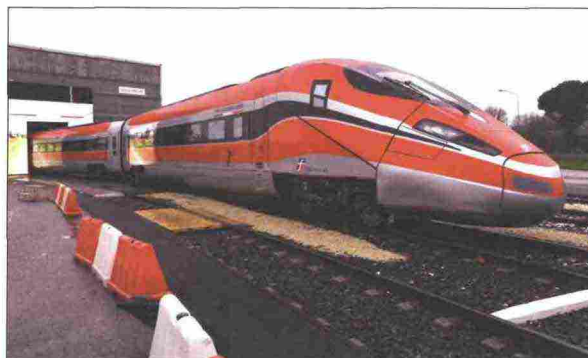
4. Il Frecciarossa 1000

"MM" : "Energia, Trasporti e Telecomunicazioni rappresentano volani fondamentali per la crescita e lo sviluppo economico di ogni Nazione e, nei Paesi industrializzati, sono di fatto diventati "bisogni primari" per la collettività, superando il vecchio ruolo di "servizi di pubblica utilità".