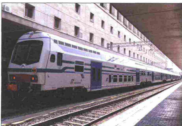
3. Il Vivalto presso la stazione Termini a Roma

"S&A" : "Per l'Italia, ASSIFER opera in un settore industriale strategico per lo sviluppo del Paese: avete individuato i mercati esteri più interessanti? Su cosa si potrebbe puntare per migliorare ulteriormente la competitività del settore?"