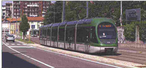
6. Il Sirio 7123

“MM” : “L’industria ferroviaria è pronta e preparata a soddisfare qualsiasi richiesta di miglioramento e di sviluppo dei sistemi di trasporto ferroviario, sia nazionale che locale, come recentemente dimostrato attraverso la fornitura di nuovi treni, metropolitane e sistemi di controllo e velocizzazione del traffico. Peraltro, l’esigenza degli utenti in termini di incremento della qualità del servizio è altrettanto chiara e quotidianamente ben manifestata.