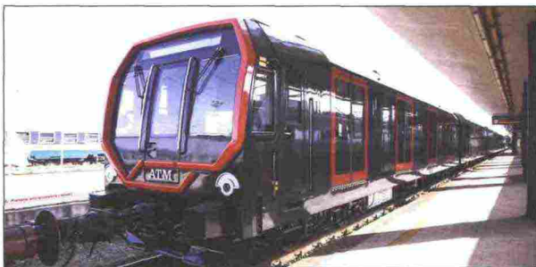
5. Un’immagine della futura metro Leonardo di Milano